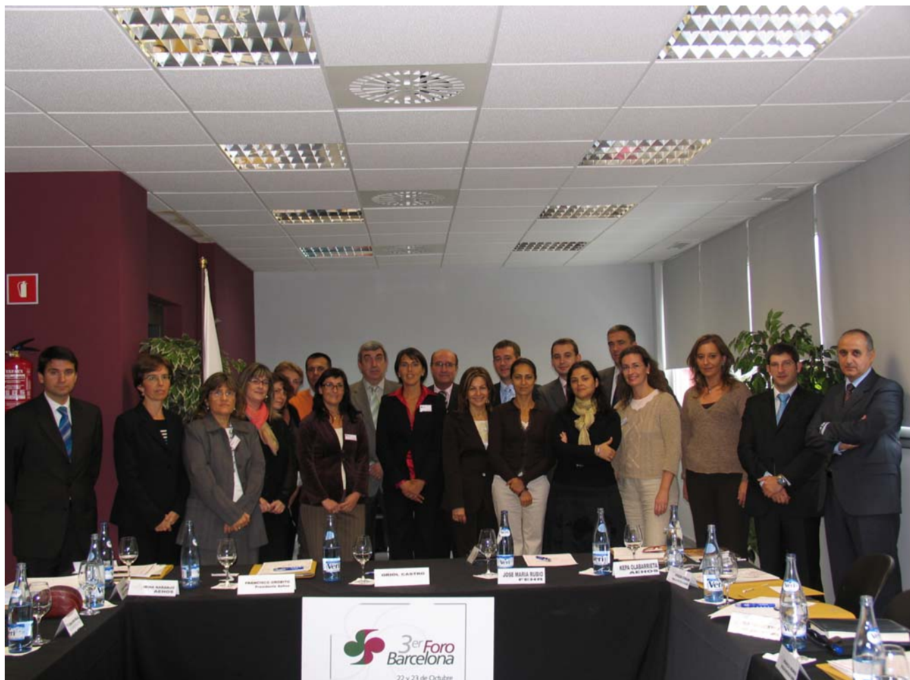
FOTO DE FAMILIA