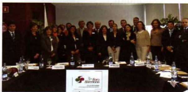
III FÒRUM DE L'ASSOCIACIÓ ESPANYOLA D'ESCOLES D'HOSTELERIA.